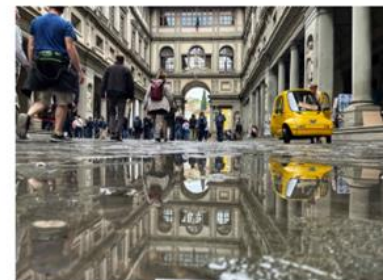
Tercer premio: Alfredo Villalba

Para más información, consulta nuestras web: alventus.com/concursos aluz.com/concursos