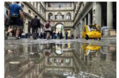
Tercer premio: Alfredo Villalba

Para más información, consulta nuestras web: alventus.com/concursos aluz.com/concursos