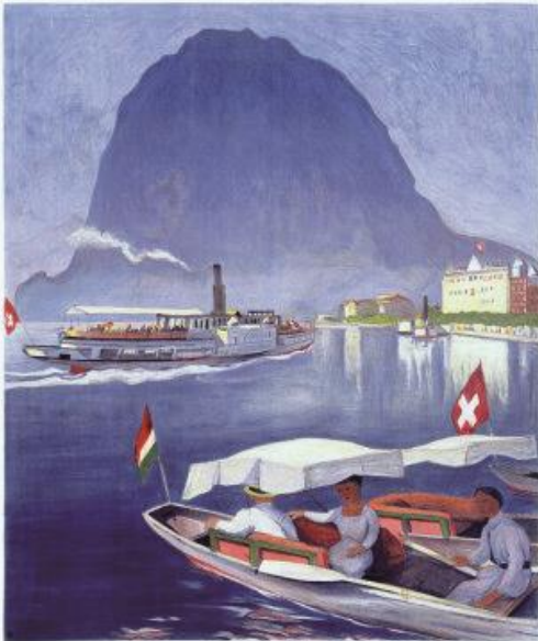
KÖNIGSSEE FREISTAAT BAYERN, MÜNCHEN

Volvemos a uno de los paisajes más sugestivos de Europa, un paisaje de cuento y de leyenda al pie de las montañas más hermosas del continente.