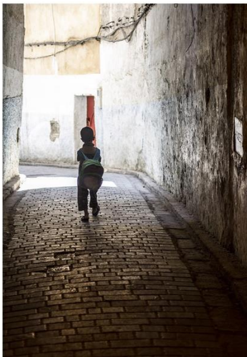
Primer Premio: Javier Arroyo Escobar

Os animamos también a participar en el concurso Foto Viajera. En esta ocasión valoramos el atractivo de la imagen como fotografía de viaje.